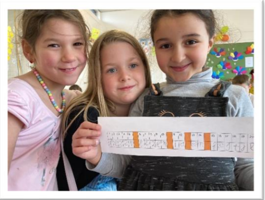
Lezen is een feestje!

Wilt u extra oefenen met lezen en het herkennen van letters/hoofdletters? Dan is PIM PAM PET een absolute aanrader!